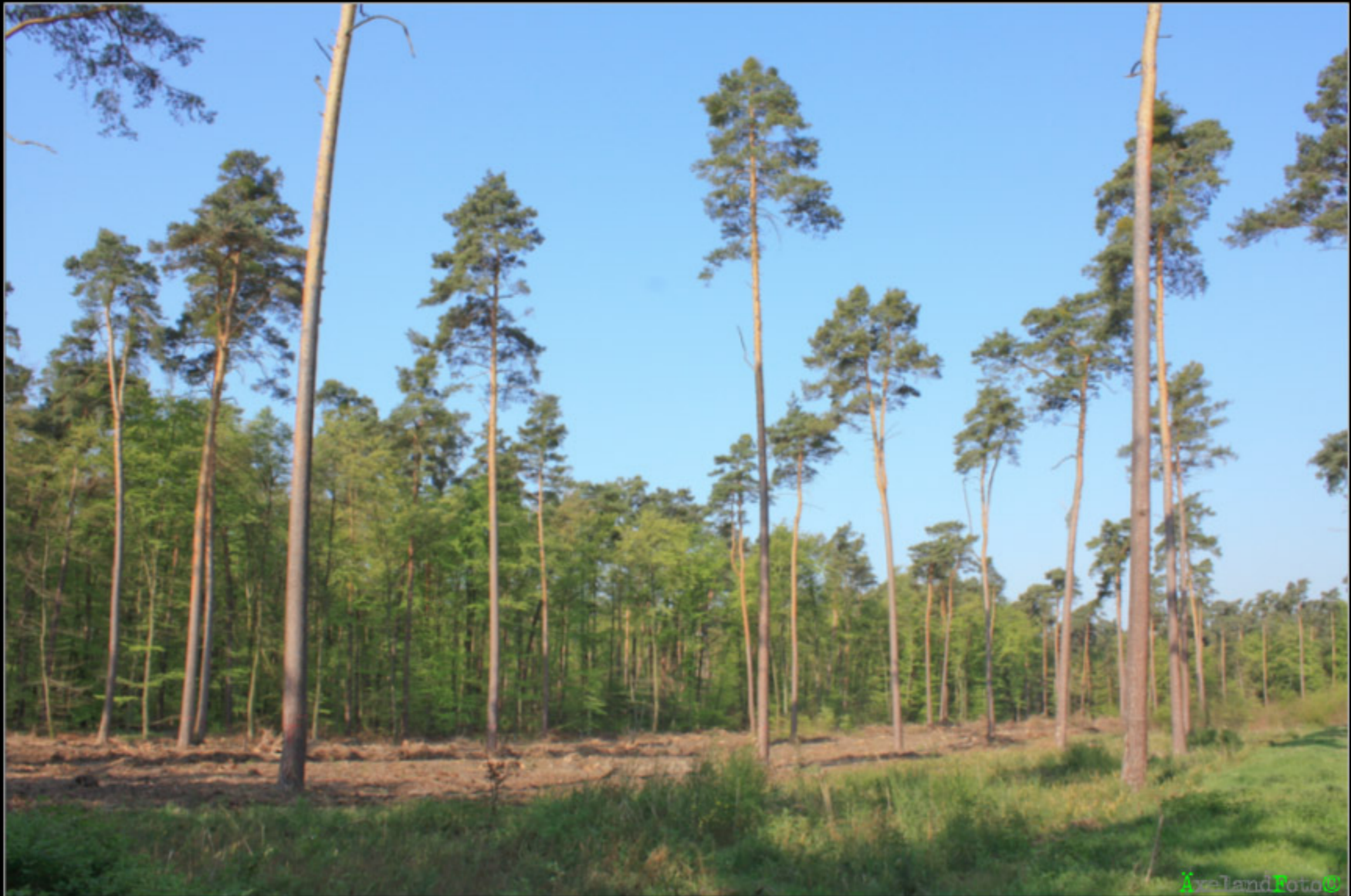
Waldbild 1: Kiefernaturverjüngung durch Saumkahlschlag