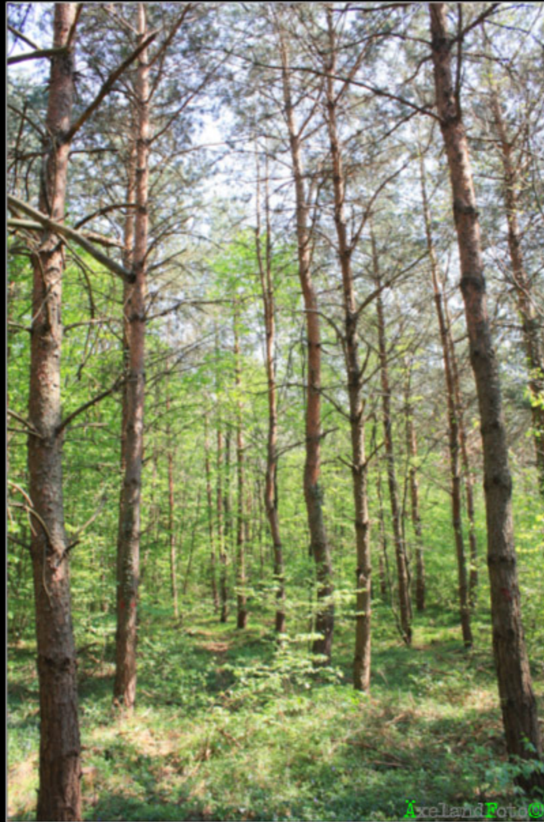
Waldbild 4: Versuchsbestand: Durchforstungsgrad <--> Wuchsleistung