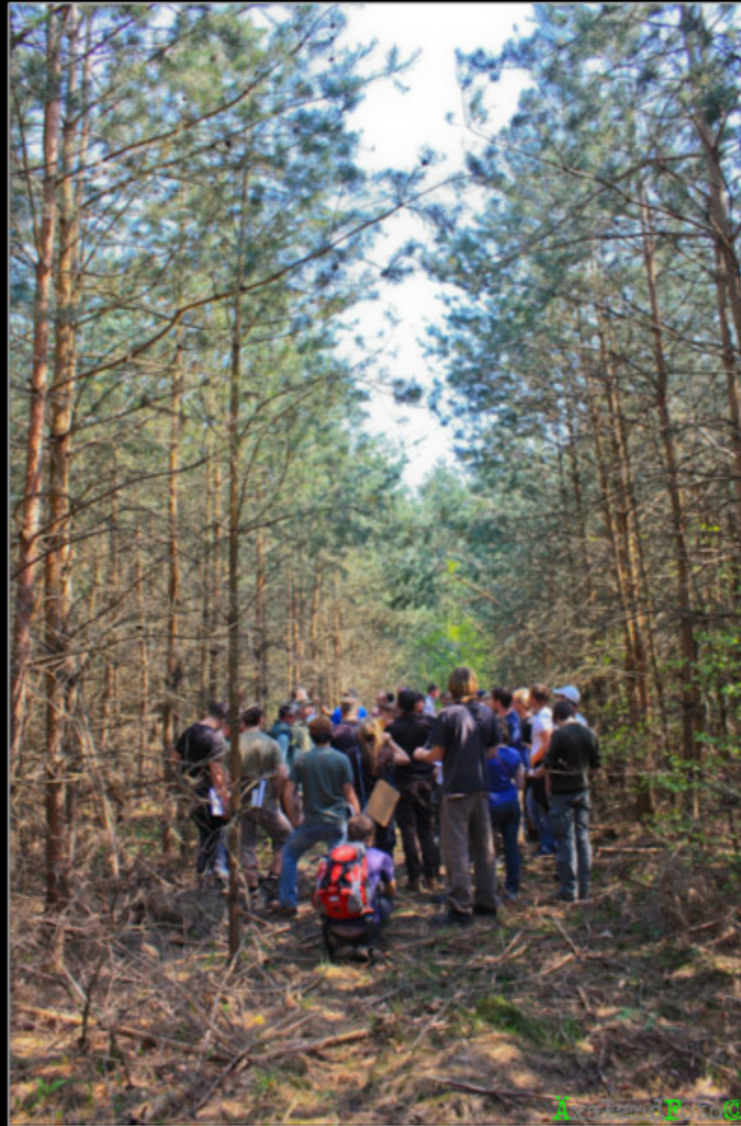
Waldbild 2: Pflege naturverjüngter Kieferndickungsbestand