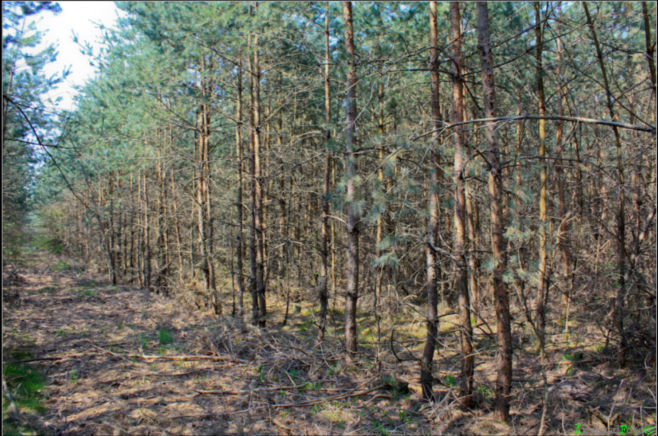
Waldbild 3: Gepflanzte Kieferndickung nach aufhauen der Rückegasse